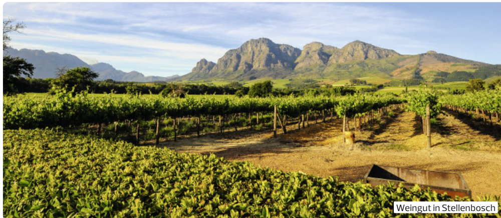
Weingut in Stellenbosch